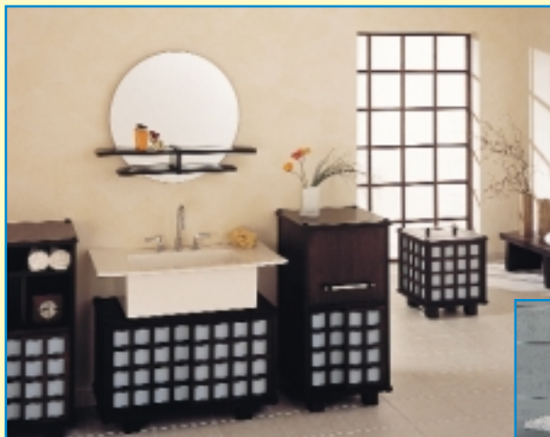
Rund um den Waschplatz