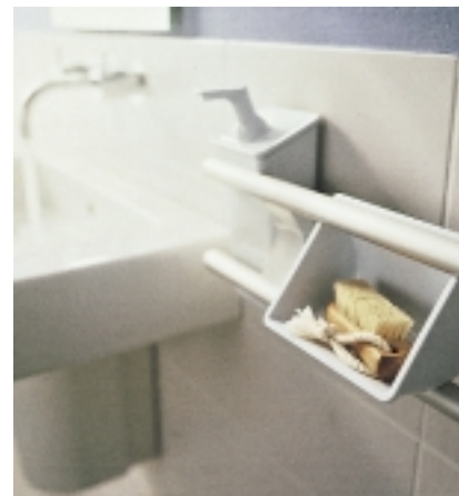
und Ablagefach finden an ein und demselben Aufnahmesystem 750 von Hewi Platz

rungsmöbeln rund um die Badewanne. Von Branchenfremden wie Modeversandhäuser, Koziol, Ikea, Habitat etc. wird er allerdings schon heute dazu eingeladen, einen Seitenblick zu riskieren.