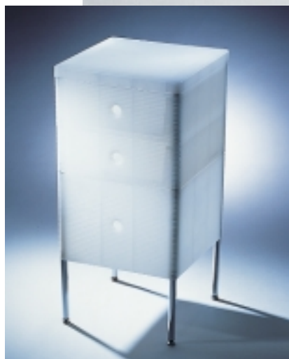
Star(c)ker Stauraum: Nicht nur im Badezimmer schafft jelly cube von Duravit einfach und effektiv Ordnung