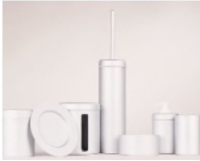
Runde Sache in Alu: Carrara & Matta hat die Badezimmer-Ausstattungsreihe 60° anlässlich seines 60jährigen Firmenjubiläums aufgelegt

wird zur Kunst. Damit verlieren die Zeichen – die charakterliche Zuschreibung der Dinge – ihren ursprünglichen Kontext, werden willkürlich. Bestes aktuelles Beispiel ist der neue Hocker „La Bohème 3“ von Kartell. Philippe Starck nahm sich eine typische Vasenform mit klassischer Kurvatur, baute sie in bunt-transparentem Acryl nach, setzte einen Deckel obendrauf und stellte sie auf den Kopf – fertig ist das perfekte Sitzmöbel für eine dekorative Badezimmerecke.