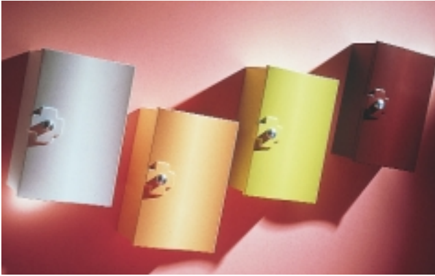
Erste Hilfe im Bad bietet Ermes von Giovanna Talocci für den italienischen Hersteller Nito

brauch nehmen zu können. Der Sanitärhandel dürfte auch noch auf den Geschmack kommen.