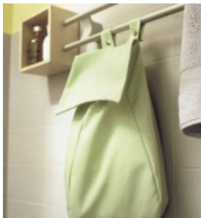
Aufnahmebereit: Wäschesack, Seifenschale und Ablagefach finden an ein und demselben Aufnahmesystem 750 von Hewi Platz

die Produktion in diesem Bereich nach Angaben des Statistischen Bundesamtes fast an letzter Stelle und hinter der von Sanitärkeramik. Dies hat sich mittlerweile geändert. Mit einem Wachstum von 35,3 % auf 401 Millionen € ist seit 1996 kein anderer Teilmarkt im Badbereich so stark gewachsen wie dieser, attestiert die Autorin des BBE-Branchenreports Wohnbäder, Sonja Koschel. Das Eingehen auf Trends wie Wellness (z. B. Duftöle, Flakons) oder Convenience (z. B. Griffe, Beleuchtung, Stauraum etc.) sowie die Ausweitung des Badezimmers auf die Wohnkultur sind verantwortlich für die starke Produktionssteigerung bei den Accessoires. Diese Produkte scheinen sich zudem als echte Exportschlager zu erweisen: Die Exportquote fällt mit ei-