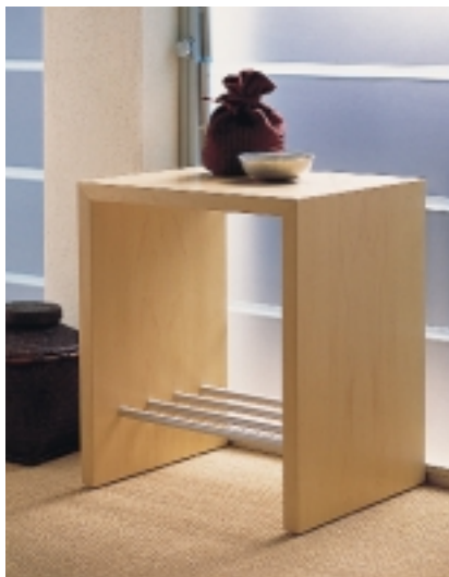
Schlichter Sitzgenuß: Der Hocker aus der gleichnamigen Sanitär-Kollektion SoHo N.Y. wurde von Reiner Moll für Villeroy & Boch gestaltet

te, haben wir bereits über 100 000 mal verkauft.“ Ergänzt wird das Deko-Programm durch Duschvorhänge, Badteppiche, Bad-Accessoires, Strandtücher oder Seifenobjekte in verschiedenen Formen, Farben und Größen.