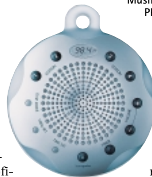
Musik für Morgenmuffel: Phoenix Product Design entwarf zusammen mit Grundig das Shower-Radio Oyster für Hansgrohe

E in Hauch von Flohmarkt kommt bei der breiten Auswahl an den zu „entdeckenden“ Kleinoden auf, die der Sanitärmarkt bereithält. Sie alle zeichnet eine Originalität aus, die der Endkunde sich als Ausdruck individuellen Geschmacks in sein Bad integrieren kann, ohne gleich den Innenarchitekten mit einer Umgestaltung beauftragen zu müssen. Es sind Objekte, die oft erfrischend leicht wirken, unbeschwert, fast willkürlich, und die das Kombi-