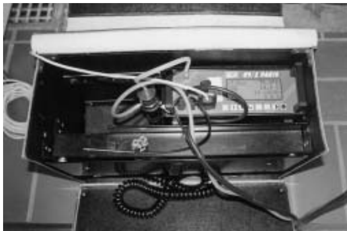
Abgasanalysegeräte nehmen die Messwerte auf und rechnen den Abgasverlust und den CO-Anteil aus

Feuerstätte diesbezüglich alles im Rahmen bleibt, erfolgt mit den Abgasverlust- und Kohlenmonoxidmessungen. Und die sind nicht nur Sache des Schornsteinfegers.