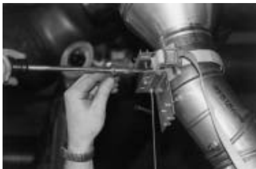
Mit einer Hilfsvorrichtung wird die Sonde für die Dauer der Messung im Kernstrom fixiert