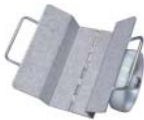
Bild 8 Den Transport-Klemm-Wagen gibt es in mehreren Ausführungen

angebrachte Scharnier drückt, desto besser funktioniert der Selbst-Klemmeffekt. Das Produkt gibt es in mehreren Spannweiten-Größen und mit unterschiedlicher Bereifung. Für den Wohnbereich gibt es eine lafruhige und bodenschonende PU-Beschichtung.