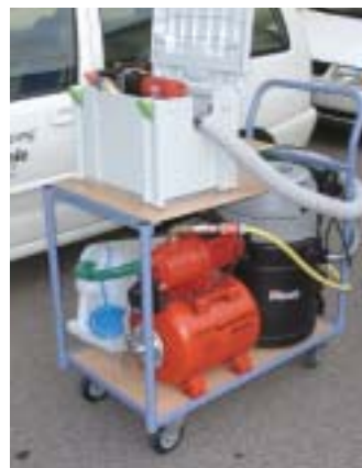
Bild 3 Optional gibt es auch eine fahrbare Versorgungseinheit

winkelt, damit auch bei beengten Arbeitsstellen der Schlauch des Staubsaugers nicht stört.