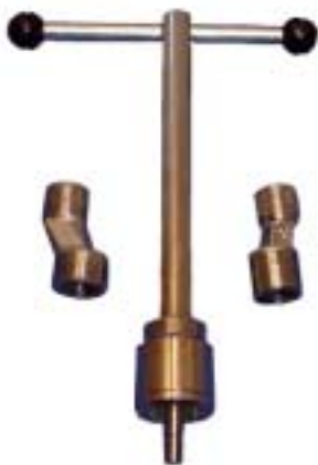
Bild 7 Spezial-Steckschlüssel für S-Anschlüsse

angebrachte Scharnier drückt, desto besser funktioniert der Selbst-Klemmeffekt. Das Produkt gibt es in mehreren Spannweiten-Größen und mit unterschiedlicher Bereifung. Für den Wohnbereich gibt es eine lafruhige und bodenschonende PU-Beschichtung.