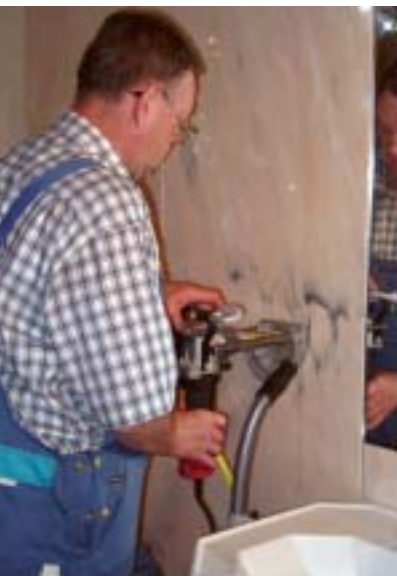
Bild 1 Die „Dübel-Bohreinheit BED 18“ arbeitet mit wassergekühlten Diamant-Hohlbohrkronen

Bohrungen in Natursteinfliesen wie Marmor und Granit sowie in Feinsteinzeug-Fliesen haben schon so manchem erfahrenen Installateur den Angstschweiß auf die Stirn getrieben. Abhilfe schafft die neuentwickelte „Dübel-Bohreinheit BED 18“ basierend auf dem Prinzip eines Miniatur-Kernbohrwerkes (Bild 1). Mit den wassergekühlten Diamant-Hohlbohrkronen kann auch in normalen Keramik-Fliesen gebohrt wer-