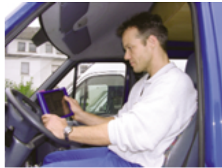
Einsatz der Label Kundendienst-Software hier in Verbindung mit einem Skeye.Pad

Mit der mobilen Lösung hat der Monteur sein virtuelles Büro und damit die wichtigsten Infos immer dabei. Alle Daten für die Kundendienstesätze (inklusive Kunden- und Anlagenhistorie) werden stets aktuell per Internet oder morgens per Ladestation auf das mobile Gerät übertragen. Zusätzlich können Statusmeldungen des Monteurs („Bin losgefahren“, „Im Stau“,