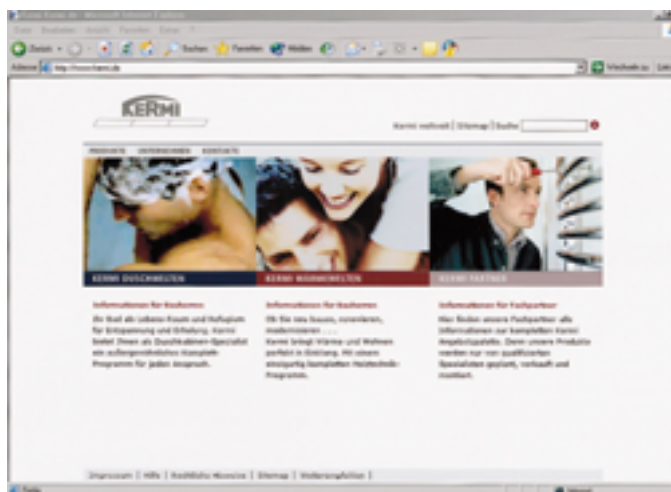
Duschwelten, Wärmewelten und Kermi-Partner sind die drei Hauptbereiche des neuen Kermi-Internetauftritts

Seine Produktinformations-CD sieht Duscholux als universelles Planungsinstrument mit integrierten Download-Möglichkeiten. Die CD enthält u. a. Aufmaßblätter, Ausschreibungstexte, Montageanleitungen,