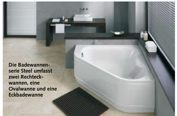
Die Badewannen-serie Steel umfasst zwei Rechteckwannen, eine Ovalwanne und eine Eckbadewanne