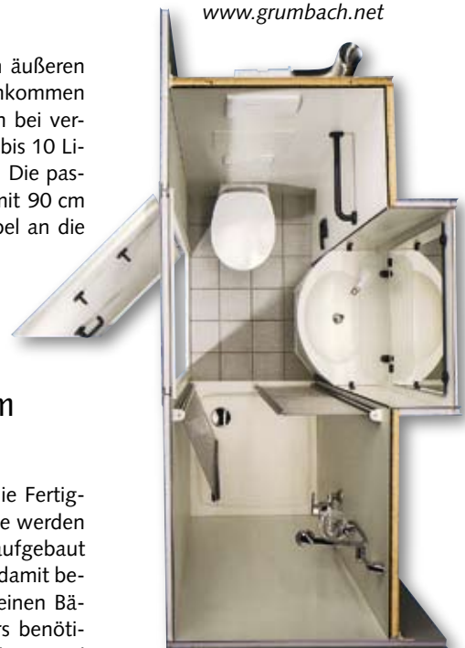
Das Fertigbad London benötigt nur 2,4 m² Grundfläche