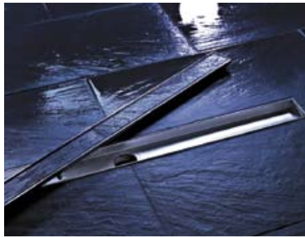
Neue Freiheit für Duschbereiche: Entwässerungsrinnen Drainline von Tece