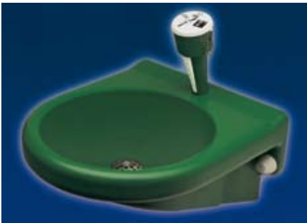
Schnelle Hilfe im Notfall: die grüne Augennotdusche mit Auffangschale von Aquarotter

Querbeet durch den Kräutergarten bietet das derzeitige Neuheiten-Angebot allerhand Heilsames und Praktisches für die zeitgemäße Badgestaltung. Auch für das Herz ist etwas dabei: Extra große Modellvarianten bei Duschen und Wannen in ansprechender Herzform und ergonomischer Passgenauigkeit sorgen für das richtige Herbst-Feeling.