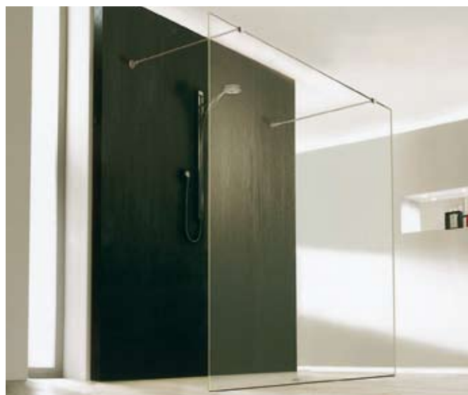
Übergröße: bis zu einer Breite von 180 cm ist eine Duschabtrennung aus dem Programm Manufaktur Studio von Hüppe erhältlich

Den Trend nach großen Duschen greift nun auch Hüppe auf und stellt im Rahmen der Serie Manufaktur Studio neue Übergrößen vor. Die Abtrennung besteht aus einer durchgängigen 8 mm starken Glasscheibe aus Sicherheitsglas und ist serienmäßig mit der Glasoberfläche Anti-Plaque ausgestattet. Die freistehende