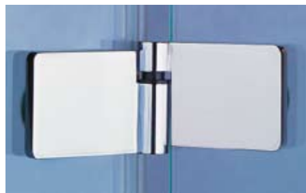
Neues Hebe-Senk-Scharnier von Heiler für bodenebene Duschabtrennungen

Der Duschabtrennungshersteller Heiler kommt dem Trend nach bodenebenen Duschen nach und optimiert seine passende Scharniertechnik aus Hartmetall (Heilift). Im geschlossenen, abgesenkten Zustand soll die Tür das untere Dichtprofil gegen die Duschwanne oder den gefliesten Boden der Kabine pressen. Dies soll die Abdichtung deutlich verbessern. Beim Öffnen hebt sich die Tür um rund 5 mm. Eine innen flächenbündige Befestigung des Scharniers soll zudem die Reinigung erleichtern. www.heiler-gmbh.de