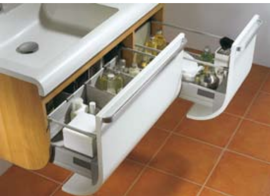
Geschwungene Front: das neue Badmöbelprogramm Horizon von Sanipa