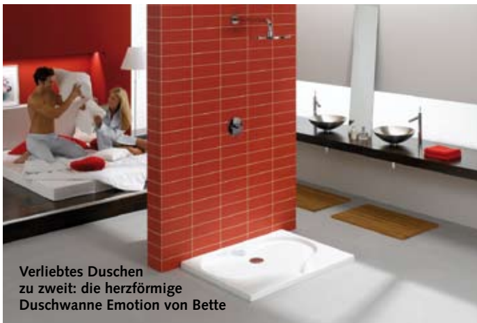
Verliebtos Duschen zu zweit: die herzförmige Duschwanne Emotion von Bette

Wohlüberlegt sollte der Einbau der neuen, herzförmigen Duschwanne Emotion von Bette