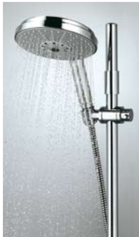
Riesenduschspaß ganz handlich: Rainshower Cosmopolitan von Grohe

Größtmöglicher Duschspaß ist nun auch bei Grohe angesagt: Der Armaturenhersteller aus Hemer erweitert das Rainshower-Sortiment um die Handbrause Cosmopolitan. Diese Handbrause mit dem markanten und verbreiterten, flachen Duschkopf ist in den beiden Durchmesser 13 cm und 16 cm erhältlich. Ein komplexes technisches Innenleben soll dafür sorgen, dass sich das Wasser gleichmäßig auf alle Düsen verteilt. Dafür wird es durch zwei stark aufeinander gepresste Schei-