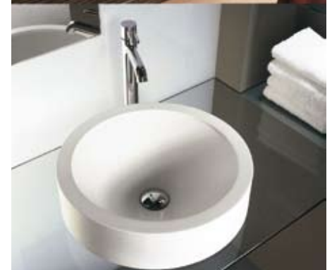
Rondo (oben) und Futura heißen die neuen Aufsatzwaschtische von Keramag aus dem Mineralwerkstoff Varicor