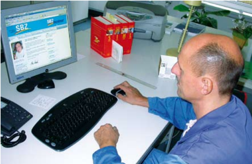
Die SHK-Fachfragen-Datenbank: Lernen und sich auf dem Laufenden halten kann auch Spaß machen

Es gibt die unterschiedlichsten Möglichkeiten, sich fachlich auf dem Laufenden zu halten oder sich auf Prüfungen vorzubereiten. Nun hat unter www.shk-fachfragen.de eine außergewöhnliche Fachfragen-Datenbank Premiere, deren Inhalte im Gegensatz zur Buchversion ständig aktualisiert und gepflegt werden. Zusammen mit Newsticker, Fachforum und Chat ist sie eine Informationsquelle erster Güte.