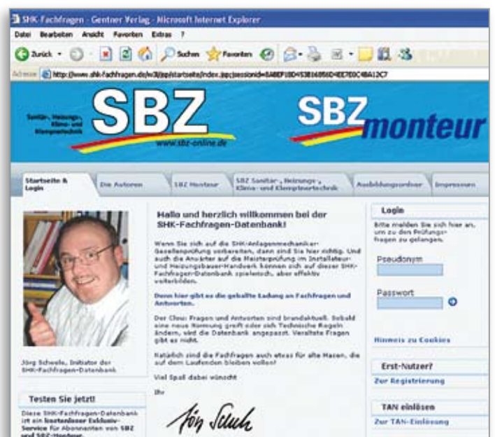
Die Nutzung der Datenbank ist kostenlos und bis zum Ende des Jahres jedermann zugänglich. Lediglich eine Anmeldung ist erforderlich

deutet darauf hin, dass man sich das Kapitel zwar schon vorgenommen hatte, damit aber noch nicht fertig ist. Ein grün gekennzeichnetes Kapitel ist vollständig bearbeitet. Hat man ein Kapitel ausgewählt, wird angegeben, wie viele Fragen es zu bearbeiten gilt.